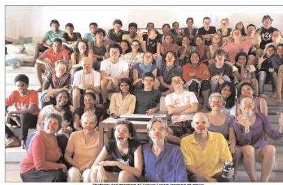
Students and teachers of Future School learning to learn.

What does Auroville mean to these young people when they live elsewhere? Do they remain connected to Auroville? If so, how