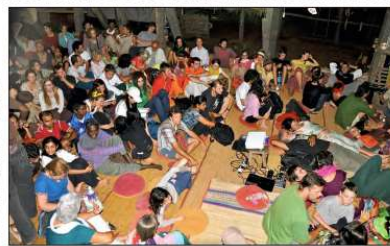
Planting in the field in Sadhana Forest.

When coming back to a forest, it's not just a forest, it's a forest. When coming back to a forest, it's not just a forest, it's a forest. When coming back to a forest, it's not just a forest, it's a forest.